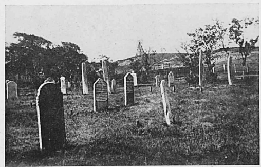
Afb. 35 e . Vijf onderkaakshelften v. Balaena mysticetus als grafpalen op het kerkhof te Vlieland. Toestand 1920.